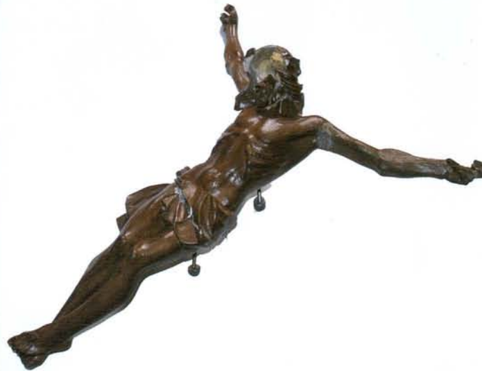
geschändeter Corpus, Wegekreuz in Herz-Jesu, Ge-Resse

Spenden werden erbeten auf das Konto der Katholischen Kirchengemeinde Liebfrauen Duisburg Stadtparkasse Duisburg BLZ 35050000 KTO 223000126 Stichwort Könzgen